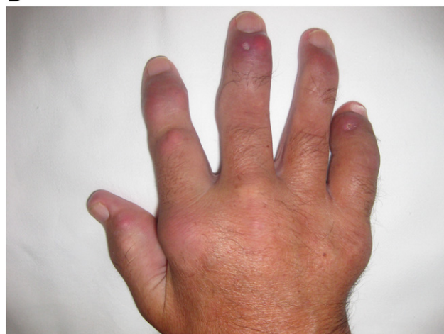
Figura 1. Tumefacción articular y tofos en mano izquierda (A) y derecha (B).