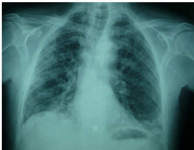
Figura 2. Radiografía posteroanterior de tórax. Se observa patrón intersticial bilateral más marcado en el hemitórax derecho.