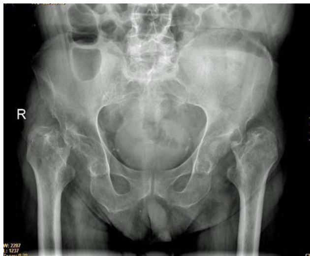
Figura 2. Destrucción de ambas cabezas femorales y acetábulos.

Seis meses después de los controles el paciente acudió a la consulta de medicina física y rehabilitación en silla de ruedas con imposibilidad para ponerse en bipedestación y refiriendo mucho dolor en ambas caderas. Por este motivo se solicitaron nuevos estudios de imagen y de laboratorio.