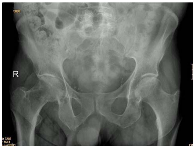
Figura 1. En la radiografía de pelvis inicial se observa estrechamiento del espacio articular y esclerosis subcondral.