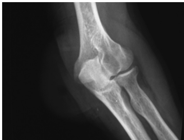
Figura 1. Radiografía anteroposterior del codo.