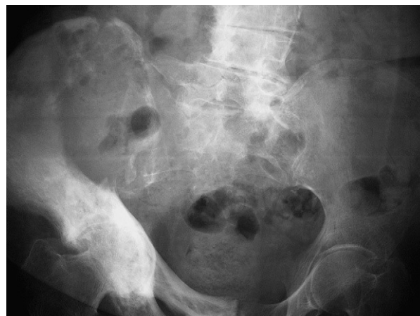
Figura 1. Radiografía simple de pelvis que muestra lesión lítica de gran tamaño en el seno de un hueso pagético en pala ilíaca derecha con destrucción cortical y fracturas.

el área geográfica, así en España la prevalencia es del 1% en la población mayor de 55 años, mientras que en Reino Unido es del orden del 4,5%. Se caracteriza por un remodelamiento óseo excesivo y anormal en zonas localizadas del esqueleto. Puede observarse como hallazgo casual en una radiografía. La clínica varía en función de su localización y la distribución de las