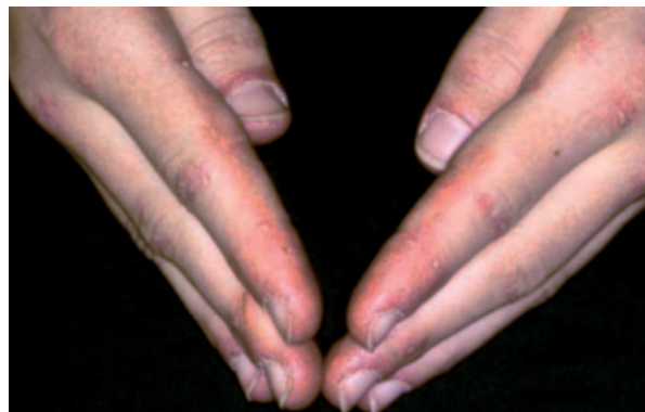
Figura 3. Manos de mecánico.

cutánea por su inespecificidad diagnóstica. En ocasiones, las lesiones cutáneas características pueden aparecer en ausencia de afectación muscular, y cuando esta situación persiste durante al menos 2 años sin que finalmente aparezca signo alguno de miopatía, se habla de dermatomiositis amiópática, que no siempre tiene un curso benigno, ya que puede asociarse a cáncer o desarrollar una neumopatía intersticial aguda de mal pronóstico 23 .