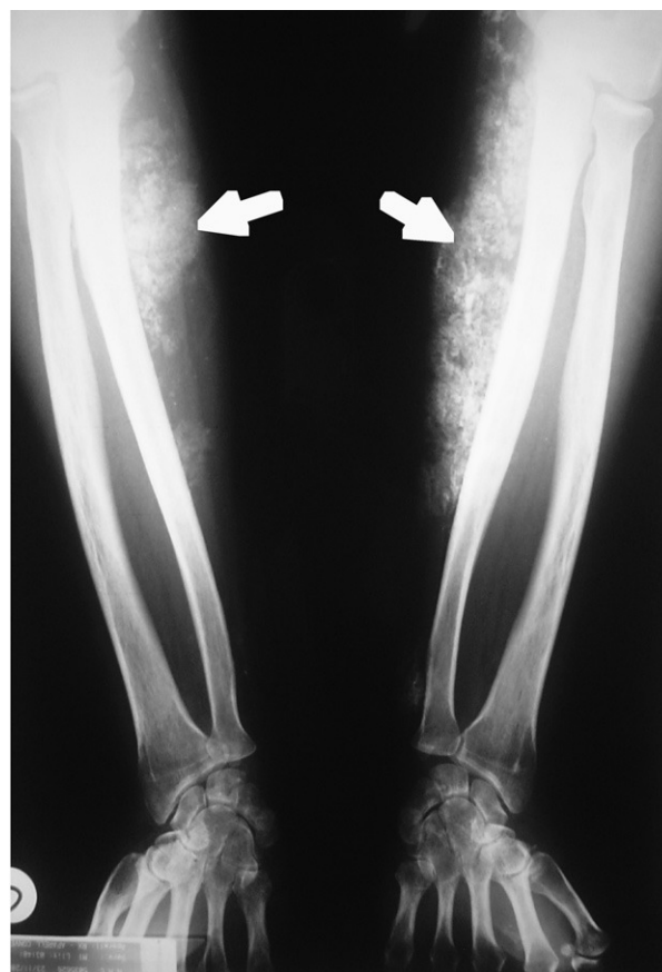
Figura 4. Calcinosis cutis.

Raynaud y “manos de mecánico”, entre otras manifestaciones menores. En ocasiones, la neumopatía intersticial adquiere el máximo protagonismo y es el motivo de consulta, la miopatía es prácticamente subclínica y el marcador inmunológico es la presencia de anticuerpos antisintetasa distintos del anti-Jo-1 32 . El sustrato patológico que subyace en la mayoría de los casos parece ser