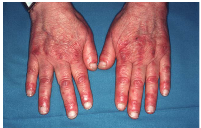
Figura 1. Eritema en el dorso de las manos que predomina sobre los nudillos y en la zona periungueal característico de la dermatomiositis.

A partir de estas localizaciones, patognomónicas o muy características, el eritema puede extenderse al resto de la cara (fig. 2) y ocupar fundamentalmente la zona central o áreas