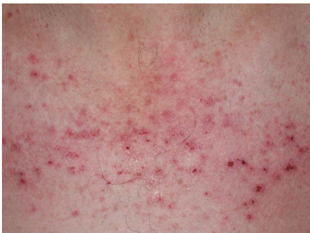
Figura 3. Lesiones eritematocostrosas en el escote de un paciente afectado de una dermatomiositis. Las lesiones eritematocostrosas son secundarias a la existencia de isquemia capilar y, según algunos autores, su presencia es indicativa de asociación a neoplasia.

seborreicas, el cuero cabelludo, el tronco (sobre todo en la cara anterior del cuello y la «V» del escote), la nuca, los hombros y el tercio superior de la espalda, lo que configura el clásico eritema en capelina o la superficie de extensión de las extremidades. Sobre el eritema, no es infrecuente la aparición de cambios de poiquilodermia (se entiende como ésta la presencia de pequeñas áreas de atrofia con telangiectasias y trastornos de la pigmentación) 19 . En ocasiones pueden verse ulceraciones o costras que indican la existencia de necrosis de la piel por isquemia (fig. 3) (v. apartado Dermatomiositis y neoplasia).