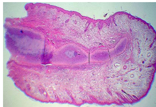
Figura 2. Imagen del corte transversal de la biopsia del cartílago auricular.