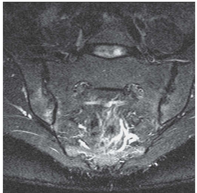
Figura 1. Imagen coronal oblicua potenciada en T2 con saturación de grasa, en la que se demuestran los cambios estructurales crónicos de sacroileítis (erosiones y disminución del espacio articular), y además se puede demostrar el cambio de señal en el hueso subcondral como signo de actividad inflamatoria. En la tomografía computarizada de esta paciente se demostraban los mismos cambios estructurales bilaterales pero en la radiografía, únicamente los cambios estructurales crónicos en la sacroilíaca izquierda.

Una artritis infecciosa puede mostrar en la RM unos signos comunes con las artritis inflamatorias, como son las erosiones y el cambio de señal con captación intraarticular y del hueso subcondral; sin embargo, presentará otros signos muy específicos y diferenciadores de una artritis inflamatoria, como la extensión de estos cambios inflamatorios y captación de contraste a partes blandas adyacentes (infil-