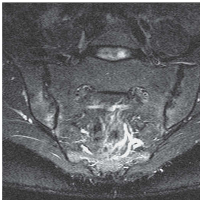
Figura 1. Imagen coronal oblicua potenciada en T2 con saturación de grasa, en la que se demuestran los cambios estructurales crónicos de sacroileítis (erosiones y disminución del espacio articular), y además se puede demostrar el cambio de señal en el hueso subcondral como signo de actividad inflamatoria. En la tomografía computarizada de esta paciente se demostraban los mismos cambios estructurales bilaterales pero en la radiografía, únicamente los cambios estructurales crónicos en la sacroilíaca izquierda.

Una artritis infecciosa puede mostrar en la RM unos signos comunes con las artritis inflamatorias, como son las erosiones y el cambio de señal con captación intraarticular y del hueso subcondral; sin embargo, presentará otros signos muy específicos y diferenciadores de una artritis inflamatoria, como la extensión de estos cambios inflamatorios y captación de contraste a partes blandas adyacentes (infil-