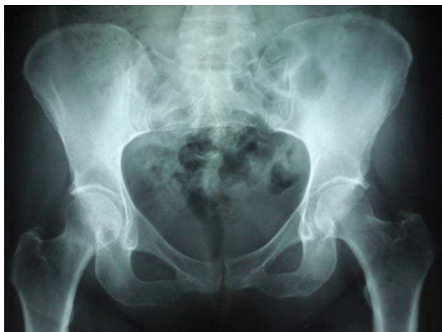
Figura 2. Rx de pelvis sin alteraciones destacables, realizada antes del trasplante hepático.

se ha relacionado con antecedentes de traumatismos y hemorragias que pueden desencadenar una reacción perióstica local 8-10 . Es posible que sea más habitual, pero que pase desapercibida, al no realizar Rx de forma sistemática tras la práctica de una biopsia ósea.