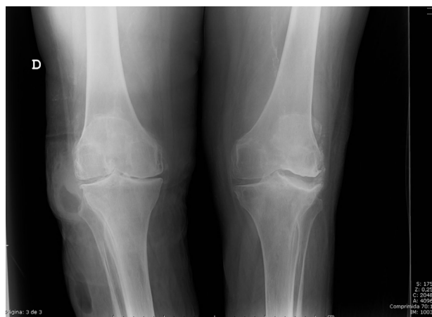
Figura 2. Radiografía de rodillas en carga. Se aprecia la presencia de una lesión de contenido hidroaéreo lateral en la rodilla derecha con aumento de partes blandas. Se aprecia también una segunda lesión del mismo aspecto distal a la lesión previamente conocida.

el cultivo del líquido sinovial confirmó la ausencia de infección articular.