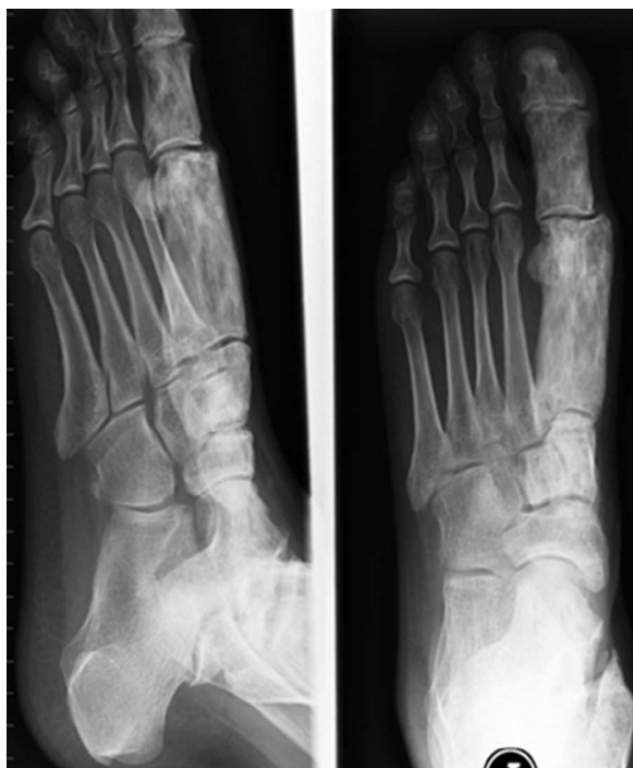
Figura 3. Radiografía lateral y anteroposterior de pie izquierdo con engrosamiento del metatarsiano y falanges del primer dedo derecho.

raras ocasiones biopsia ósea. El pronóstico depende de la extensión y grado de afectación ósea, edad de inicio y manifestaciones extraesqueléticas 2 . La tasa de malignización es rara 6 .