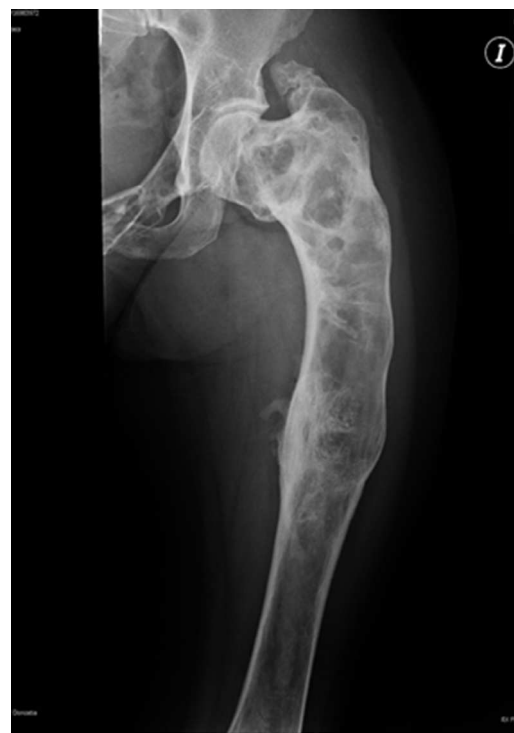
Figura 1. Radiografía anteroposterior de fémur izquierdo con una deformidad en «cayado de pastor», una cortical adelgazada e imágenes radiolucidas expansivas.

La poliostótica se observa en un 30% de los casos. Suele diagnosticarse en la infancia. Afecta el cráneo, cara, pelvis, columna y hombro. Se asocia a síndrome de McCune-Albright en un 2% de los casos (DF, pigmentación cutánea y pubertad precoz) 2 . Produce disimetrías, alteraciones en la marcha, dolor mecánico y fracturas de estrés 5 . El diagnóstico de DF es radiológico, requiriéndose en