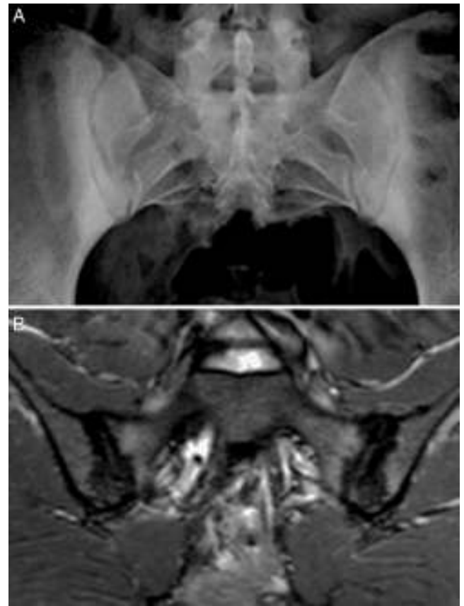
Figura 2. Caso 2. A) Radiografía con marcada esclerosis bilateral en ambos márgenes óseos de las articulaciones sacroiliacas. B) RM de sacroiliacas que muestra esclerosis, erosiones y edema óseo demostrativo de sacroilitis activa.

Caso 3: mujer de 50 años, diagnosticada de espondilitis anquilosante hacía 3 años, con sacroilitis bilateral en radiografía simple y HLA B27 positivo. Tenía dolor lumbar inflamatorio severo invalidante y refractario, con insuficiente respuesta a antiinflamatorios