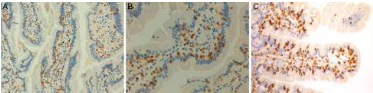
Figura 4. Biopsias duodenales tras tinción inmunohistoquímica para CD3 en las que se evidencia un aumento del número de linfocitos intraepiteliales, sin acortamiento vellositario ni hiperplasia de criptas. A) Aumento del número linfocitos intraepiteliales a lo largo de la vellosidad intestinal (20×), caso 1. B) Detalle del incremento de linfocitos intraepiteliales (40×), caso 2. C) Detalle del cúmulo de linfocitos intraepiteliales en el ápice de la vellosidad intestinal (40×), caso 4, cortesía del Dr. Fernando Casco, Histocitomed.

Estos 4 pacientes tienen espondiloartritis axial, 2 de ellos con espondilitis anquilosante y uno con espondiloartritis psoriásica. Son sensibles al gluten, con clara respuesta clínica a la DSG a pesar de haberse descartado la EC. En 2 casos hay un familiar celíaco. La mejoría del dolor lumbar crónico ha sido muy relevante, hasta el punto de la resolución del cuadro clínico, y en un caso se observa remisión del edema en la RM de sacroiliacas tras un largo tiempo de seguimiento. Además, en los 3 pacientes en que ha habido exposición al gluten, esta ha ido seguida de recidiva clínica. Es improbable que una mejoría clínica como la descrita sea debida a casualidad o a efecto placebo. La observación de la linfocitosis intraepitelial junto con la evolución clínica apoya el concepto de espondiloartritis enteropática por SGNC. La figura 4 muestra las biopsias duodenales de los casos 1, 2 y 4, en las que se observa un aumento de los linfocitos dentro del epitelio intestinal.