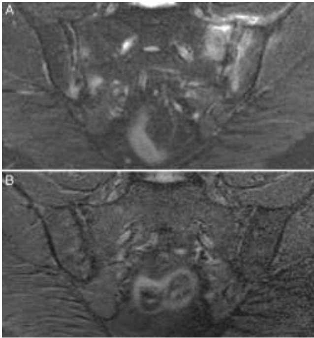
Figura 3. Caso 3. A) RM con afectación bilateral asimétrica con edema óseo en ambas articulaciones y capsulitis en la sacroiliaca izquierda, demostrativo de sacroiliitis activa. B) Resolución completa del edema óseo y de la capsulitis a los 17 meses de dieta sin gluten.

en remisión del dolor lumbar y tenía recidiva si tomaba gluten. No hubo mejoría de la psoriasis cutánea.