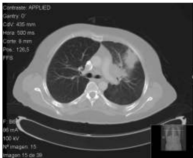
Figura 1. TC pulmonar. Condensación en el lóbulo superior izquierdo que contacta con pleura costal anterior y se acompaña de adenopatías hiliares ipsilaterales.

Revisión retrospectiva del registro de pacientes con terapias biológicas de la Sección de Reumatología del Hospital General Universitario de Alicante, que incluía desde 1999 hasta 2012 (fecha del estudio) a un total de 771 pacientes. Se han seleccionado las historias clínicas de pacientes que cumplían los siguientes criterios de inclusión: a) tratamiento actual o previo con fármacos anti-TNF- \alpha ; b) estudio de cribado de TB negativo previo al tratamiento anti-TNF- \alpha ; c) TB activa diagnosticada durante el tratamiento anti-TNF- \alpha , y d) sospecha de primoinfección tuberculosa; para este estudio se consideró primoinfección tuberculosa si el diagnóstico se produjo tras al menos 12 meses con el agente biológico 7 . El protocolo de cribado de TB en nuestro centro consiste en test de Mantoux ( \pm booster), radiografía de tórax y baciloscopia de esputo y orina, si procede. Se han revisado las variables clínicas (manifestaciones de enfermedad de base y de la tuberculosis), epidemiológicas (tiempo de tratamientos, estudio de contactos), terapéuticas (tratamientos recibidos y duración) y de desenlace (resultados de prueba y respuesta a tratamiento) de los casos que cumplieron los criterios de inclusión.