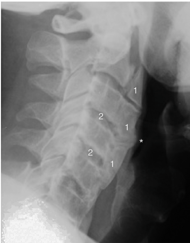
Figura 2. Radiografía cervical lateral (2014). Se aprecia un aumento del tamaño de la osificación del ligamento anterior cervical con afectación global de la columna cervical (1) se puede observar como impronta (*) hacia la vía aérea-digestiva. También se observa una conservación relativa de la altura del espacio intervertebral (2).

Dado el cuadro constitucional, se le practicó una gastroscopia y un tránsito esófago-gastro-duodenal, cuyo resultado no mostró alteraciones.