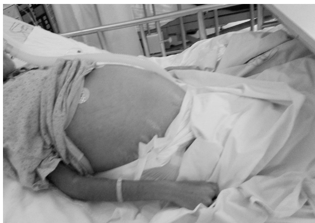
Figura 1. Ascitis masiva en la paciente.