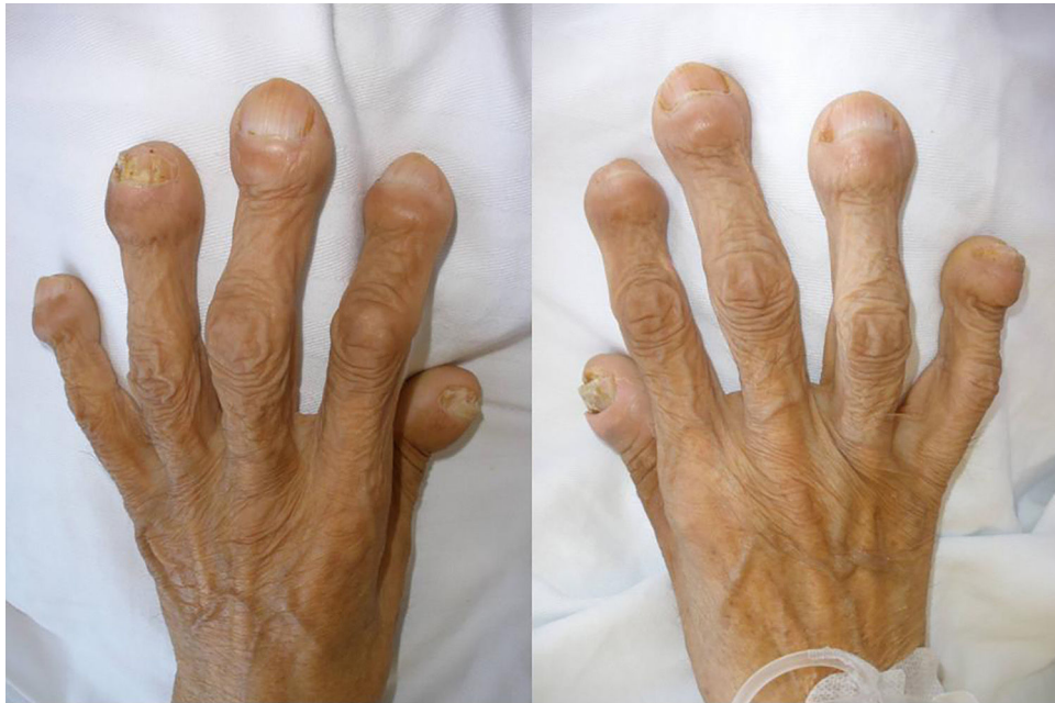
Figura 1. Acropaquias bilaterales de gran tamaño.