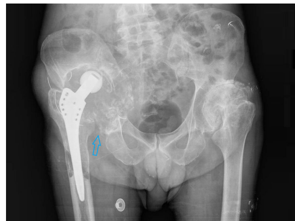
Figura 1. Radiografía simple de cadera bilateral en proyección AP con importantes signos de resorción ósea de la articulación coxofemoral derecha (flecha).

Presentamos el caso de un paciente de 66 años, recientemente diagnosticado de carcinoma vesical tras estudio de hematuria, que presenta cuadro de cojera y masa inguinal derecha indolora, de consistencia dura a la palpación. Como antecedentes personales destaca una artroplastia total de cadera derecha hace años por artrosis severa. La radiografía AP de cadera bilateral mostraba una importante destrucción ósea de la articulación coxofemoral derecha (fig. 1). Ante dichos hallazgos, se realizó PET/TC con ^{18}\text{F} -FDG como estudio de extensión de proceso neoplasia primario vesical, con posibilidad de afectación metastásica ósea. En las imágenes a los 60 min postinyección de la ^{18}\text{F} -FDG se evidenció una gran masa de partes blandas multilobulada hipermetabólica en la región ilíaca derecha, que englobaba el material protésico y producía lisis de la pala ilíaca, con importante destrucción de la articulación coxofemoral (fig. 2). Se procedió a realizar biopsia ante los hallazgos indicativos de malignidad, con resultado de enfermedad de partículas por desgaste de los componentes de artroplastia. El paciente desestimó la posibilidad de revisión quirúrgica y se encuentra actualmente en seguimiento periódico.